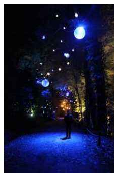
Parc de Trévarez illuminé – Collectif Les Oeils