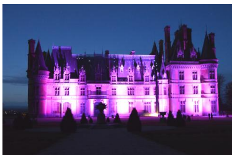
Château de Trévarez illuminé – Collectif Les Oeils