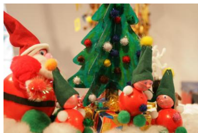
Création 1er prix jeunes - œuvre collective (2013)