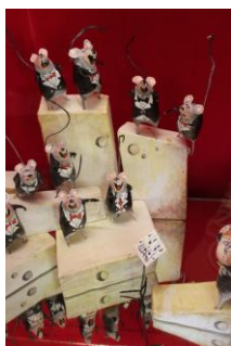
La fête au château