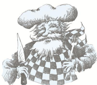
Les recettes de Léon © Albert Lemant

Plus de photos sur simple demande au service presse ( presse@cdp29.fr ou 06 38 38 90 70)