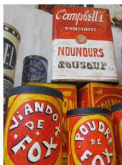
La fête au château © Kiki et Albert Lemant