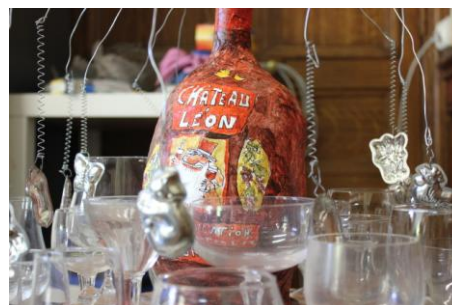
Cuvée Château Léon