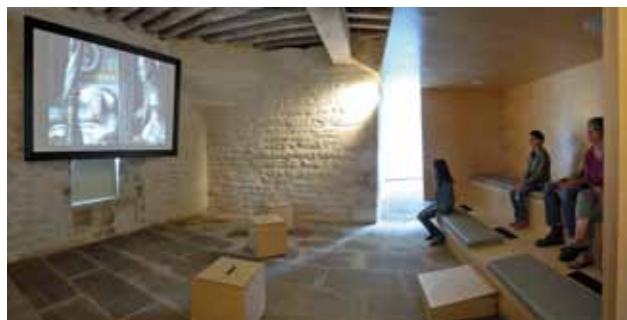
Le destin d'un château L'auditorium