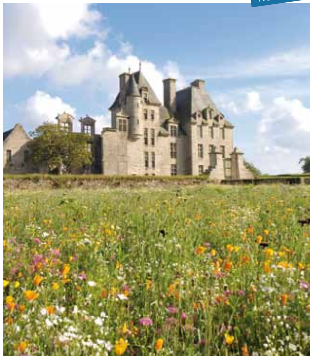
Le jardin de propreté, Château de Kerjean

Le jardin de fleurs est l'évocation historique du jardin de propreté de Kerjean aujourd'hui disparu. La reprise des tracés géométriques en vogue à la Renaissance mais aussi au 18 e , période choisie pour la restauration des alignements du château, et la plantation de différents mélanges de fleurs annuelles en font un jardin régulier du 21 e siècle. Le promeneur pourra déambuler sur des allées strictement tondues, au milieu de floraisons exubérantes.