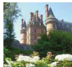
Domaine de Trévarez