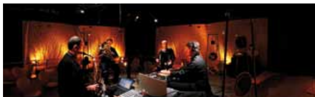
Les Confidences sonores