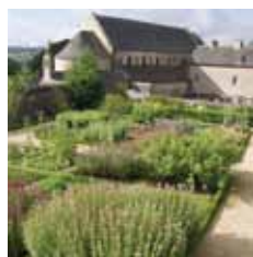
Abbaye de Daoulas