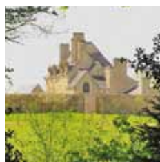
Manoir de Kernault