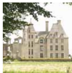
Château de Kerjean