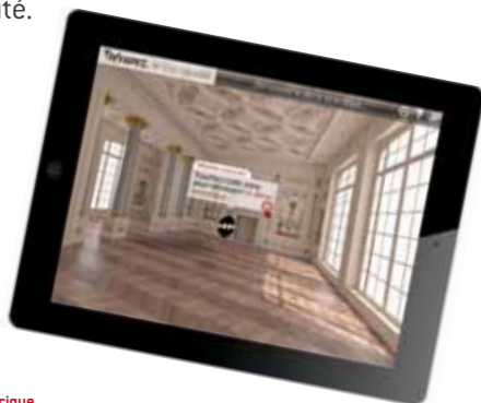
La tablette numérique

Bombardée par les Alliés en 1944, l'aile ouest du château ouvre à nouveau ses portes. Une visite des lieux propose de superposer l'état actuel de cet espace du château avec la vision de ce qu'il était au début du 20 e siècle grâce à la « réalité augmentée ». Munis de tablettes numériques, les visiteurs se promènent dans ce qui fut un grand salon et découvrent à la fois ce qu'ils ont sous les yeux - un extraordinaire écorché montrant des techniques de construction novatrices pour l'époque (poutrelles métalliques) -, et ce que leur révèlent les images de la tablette en situation – des décors inspirés de l'Antiquité.