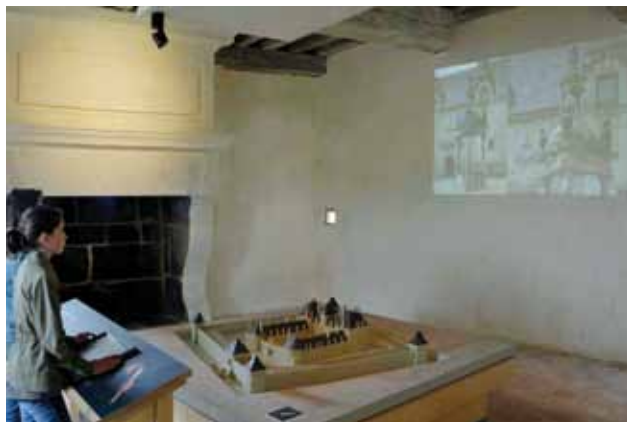
Une architecture de prestige La maquette interactive du château

Toutes ces questions trouvent leur réponse au travers de dispositifs multimédias surprenants et novateurs : maquette animée, lunette d'exploration nouvelle génération, ... La scénographie accorde à ces outils une place prépondérante, permettant au visiteur d'être acteur. Ainsi, le château du 16 e siècle devient un lieu culturel ancré dans le 21 e siècle.