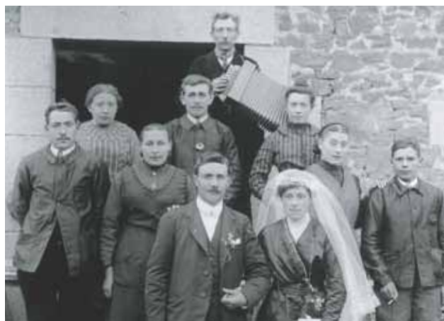
Le «mariage Chevalier» par le photographe Fleury de Luitré