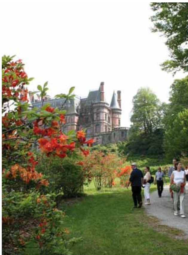
Le Domaine de Trévarez