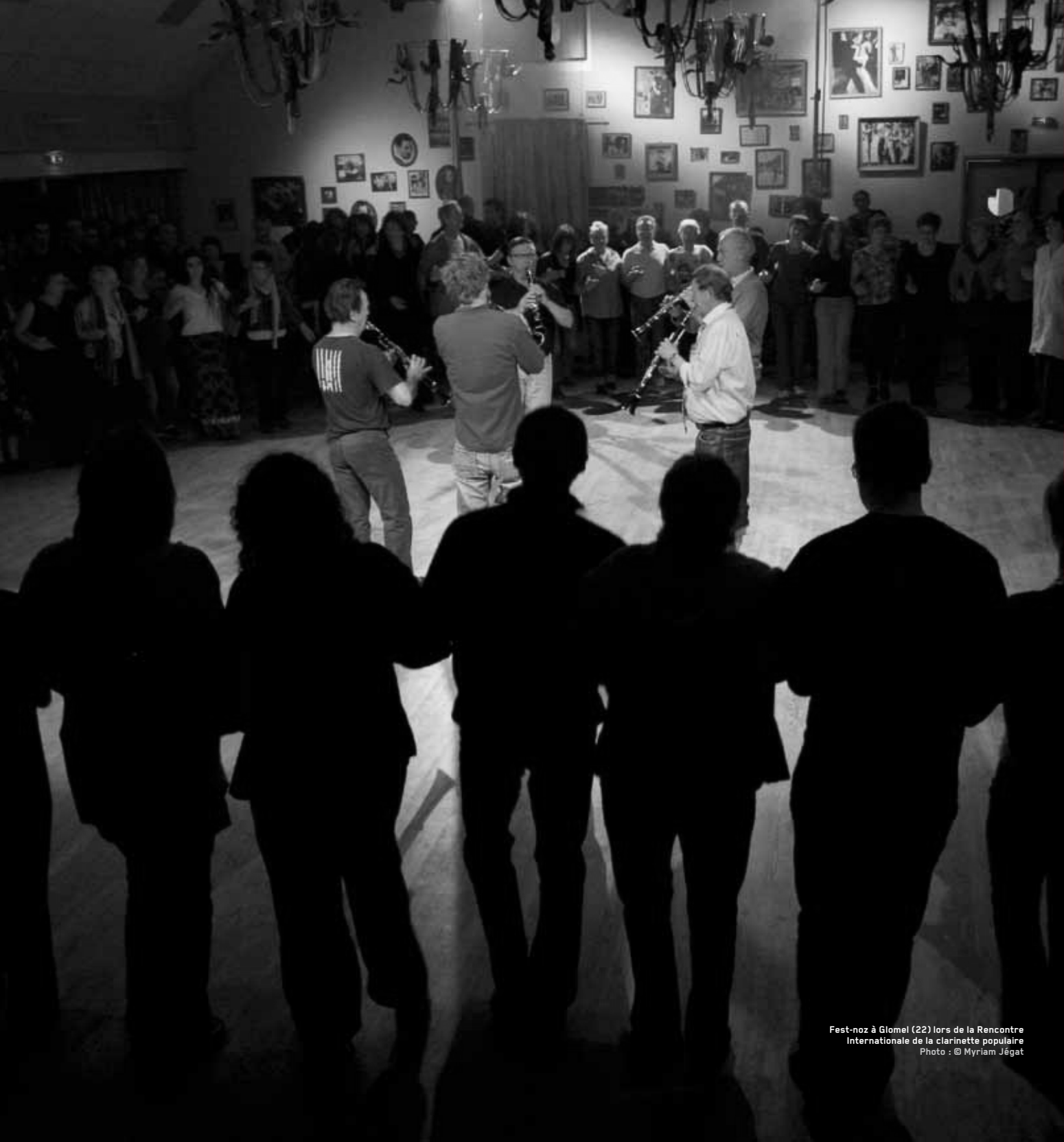
Fest-noz à Glomel (22) lors de la Rencontre Internationale de la clarinette populaire