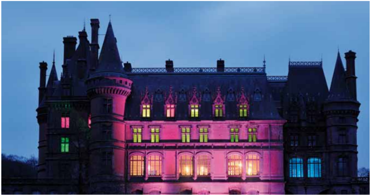
Illuminations du château, Noël à Trévarez 2011