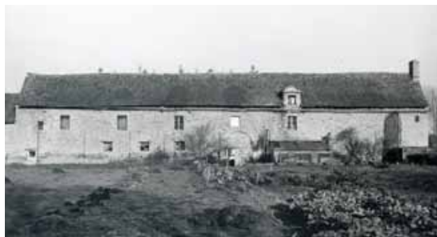
Le Manoir de Kernaut

Comment rendre compte d'une histoire longue de cinq siècles ? Comment parler de bâtiments aux styles différents et aux usages changeant au fil du temps ? Comment dire la richesse d'un paysage ?