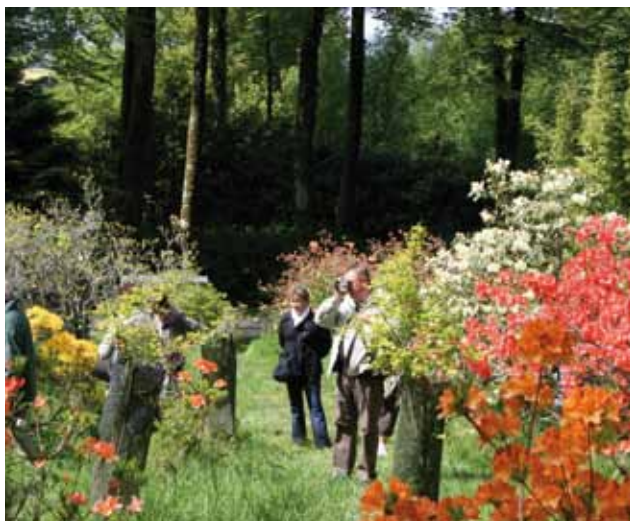
Festival du Camélia

Samedi 17 et dimanche 18 mars - Domaine de Trévarez