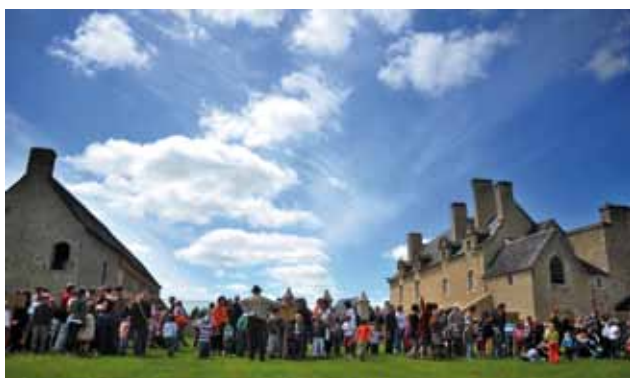
Manoir de Kernault