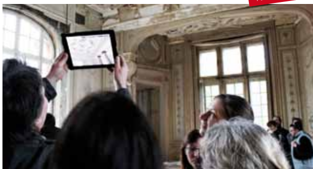
Visite de l'aile ouest

Bombardée par les Alliés en 1944, l'aile ouest du château ouvre à nouveau ses portes. Une visite des lieux propose de superposer l'état actuel de cet espace du château avec la vision de ce qu'il était au début du 20 e siècle grâce à la « réalité augmentée ». Munis de tablettes numériques, les visiteurs se promènent dans ce qui fut un grand salon et découvrent à la fois ce qu'ils ont sous les yeux - un extraordinaire écorché montrant des techniques de construction novatrices pour l'époque (poutrelles métalliques) -, et ce que leur révèlent les images de la tablette en situation – des décors inspirés de l'Antiquité.