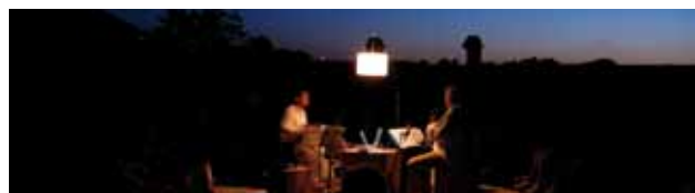
Ostinato spectacle

Installation sonore du 23 au 29 juillet - Spectacle dimanche 29 juillet - Domaine de Trévarez