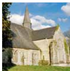
Abbaye du Relec