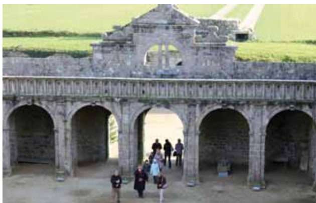
Château de Kerjean