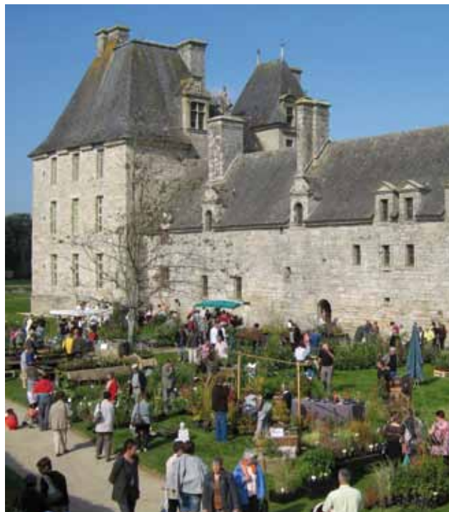
Journées des plantes de collection

Samedi 29 et dimanche 30 septembre - Château de Kerjean