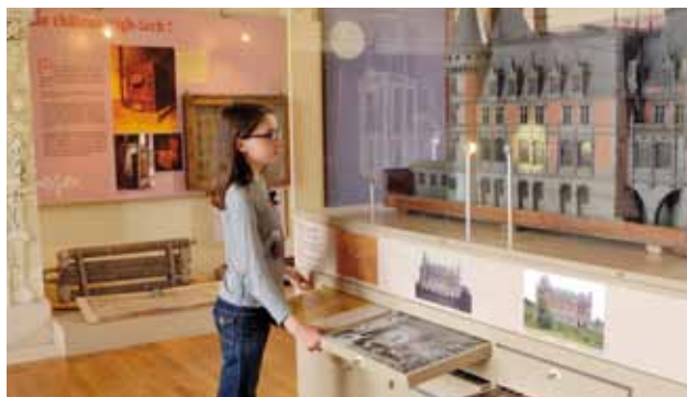
L'exposition Bâtir un rêve

La découverte de l'histoire du domaine ne serait pas complète sans aborder le parc : la « promenade de la marquise » conduit les visiteurs sur les allées d'honneur du domaine, depuis l'une des entrées principales jusqu'au château. La promenade « D'un jardin à l'autre » invite les visiteurs à découvrir les sentiers de plaisance du parc : les chemins cavaliers, le jardin japonais (à l'image de celui de Courances), les cascades, le jardin d'inspiration italienne, les collections contemporaines de rhododendrons