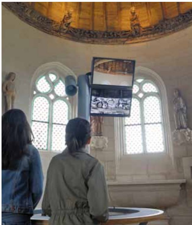
Les yeux vers le ciel Lunette d'observation de la sablière sculptée de la chapelle