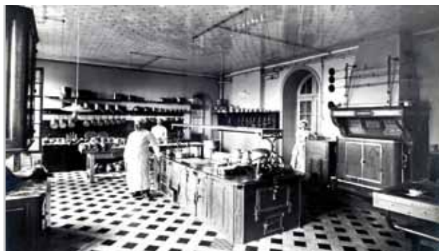
La cuisine du château de Trévarez en 1910

Construit entre 1893 et 1907, le Domaine de Trévarez est la réalisation du rêve d'un homme, James de Kerjégu. Homme ambitieux, établi politiquement et socialement, notamment grâce à son mariage, il choisit les architectes de la haute bourgeoisie, les Destailleur, pour concrétiser l'expression de sa réussite. Homme de son temps, il dote le château des équipements techniques les plus novateurs en cette fin du 19 e siècle, comme l'eau courante, l'électricité ou encore les ascenseurs.