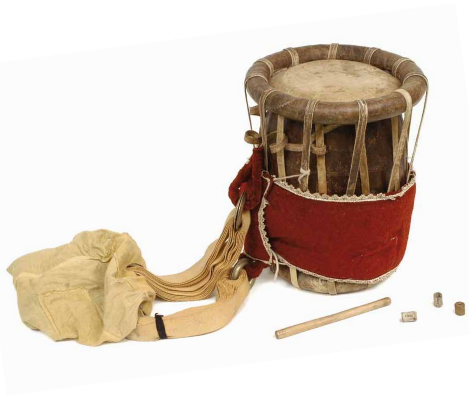
Tambour en tonneau taval, région du Kerala, Inde Bois, peau, laiton, coton, feutre, papier mâché