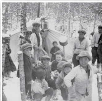
Innu de La Romaine sur leur territoire de chasse, entre 1949 et 1960

Des photographies, tirées des collections du Centre d'archives de la Côte-Nord et du Musée amérindien de Mashteuiatsh, illustrent le rapport étroit qui unissait ce peuple hors du commun à son environnement. Guidée par les images et puisant dans sa propre expérience, l'auteure innue Joséphine Bacon a créé un texte sensible et poétique qui forme la trame de cette saisissante plongée dans le quotidien du peuple innu.