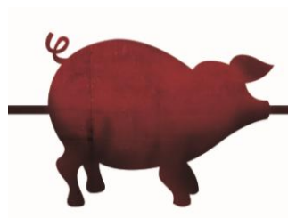
Scénographie « de Bouche à Oreille »