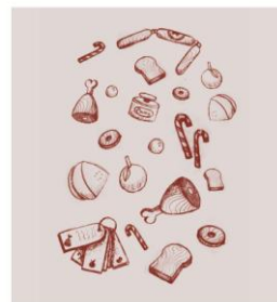
Scénographie « de Bouche à Oreille »