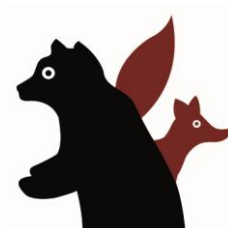
L'ours et le renard - "Scénographie « de Bouche à Oreille »