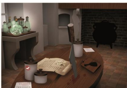
La cuisine de l'ogre Scénographie « de Bouche à Oreille »