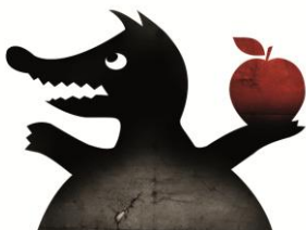
Le loup - "Scénographie « de Bouche à Oreille »