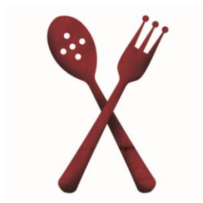
Scénographie « de Bouche à Oreille »