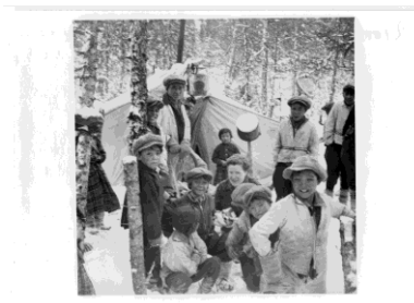
Innus de La Romaine sur leur territoire de chasse, entre 1949 et 1960