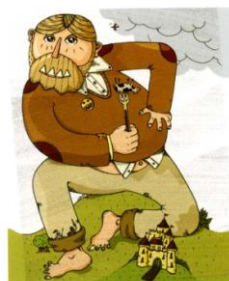
Ogre © Imagerie d'Epinal – Guillaume Roussel