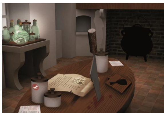
Projet pour la cuisine de l'ogre où tout est surdimensionné et où les histoires sortent des ustensiles de cuisine.