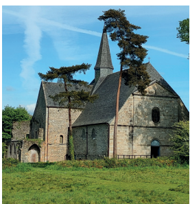
≡ Abbaye du Relec