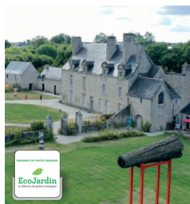
≡ Manoir de Kernault