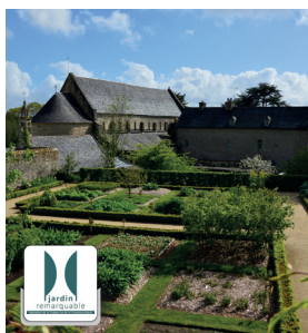
≡ Abbaye de Daoulas