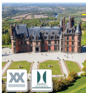
≡ Domaine de Trévarez