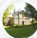
ABBAYE DU RELEC