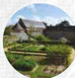
ABBAYE DE DAOULAS

Après le Château de Kerjean, poursuivez votre visite en découvrant les 4 autres sites de Chemins du patrimoine en Finistère