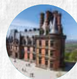
DOMAINE DE TRÉVAREZ