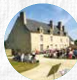
MANOIR DE KERNAULT