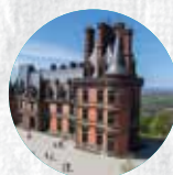
DOMAINE DE TRÉVAREZ