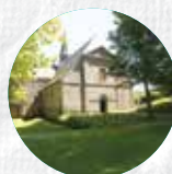
ABBAYE DU RELEC