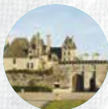
CHÂTEAU DE KERJEAN