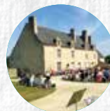
MANOIR DE KERNAULT