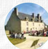
MANOIR DE KERNAULT