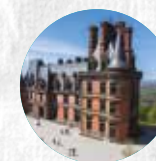
DOMAINE DE TRÉVAREZ