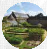
ABBAYE DE DAOULAS