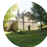
ABBAYE DU RELEC