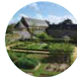
ABBAYE DE DAOULAS

Après le Manoir de Kernault poursuivez votre visite en découvrant les 4 autres sites de Chemins du patrimoine en Finistère