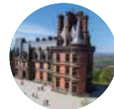
DOMAINE DE TRÉVAREZ

5 sites et autant de lieux où le plaisir de découvrir et de s'évader se nourrit de moments de partage, de savoir et d'étonnements.