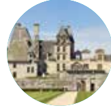
CHÂTEAU DE KERJEAN