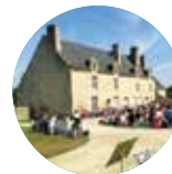
MANOIR DE KERNAULT