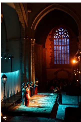
Arrée Voce 2017