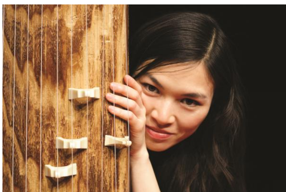
Etsuko Chida