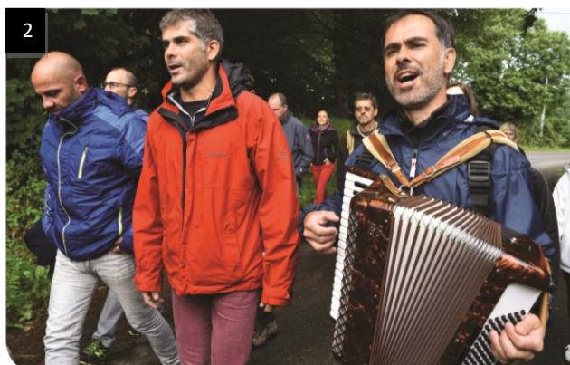
4. Didgori © Ensemble Didgori