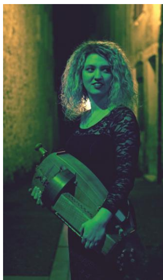
Trio Fourniau