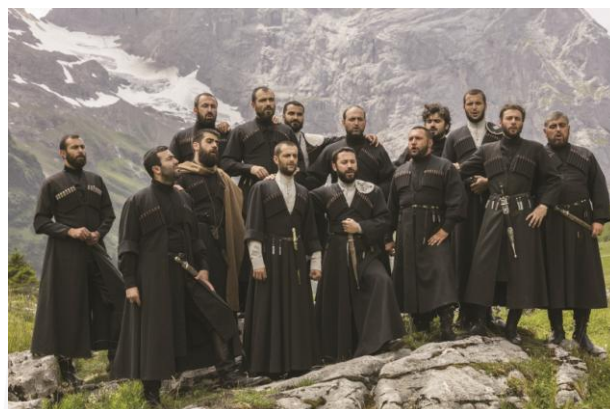
Didgori © Ensemble Didgori