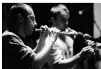
Le Dissez-Bodros