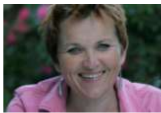
Sophie Le Hunsec © Droits réservés