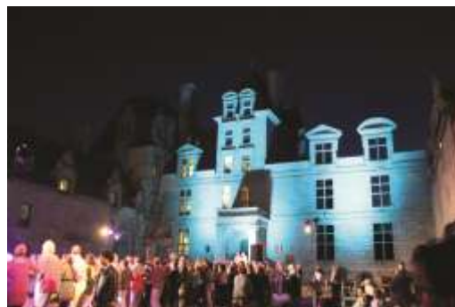
Fest Noz au Château de Kerjean