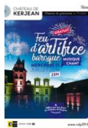
Feu d'artifice au Château de Kerjean