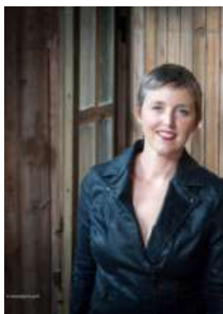
Noluen Le Buhé