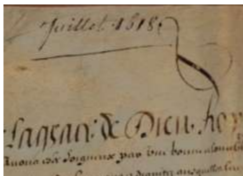
Manuscrit de la lettre royale