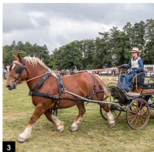
1- 2 - 3. Concours d'attelage © Droits réservés