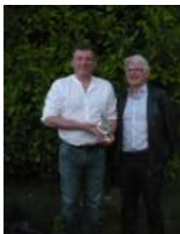
Talec - Suignard © Droits réservés