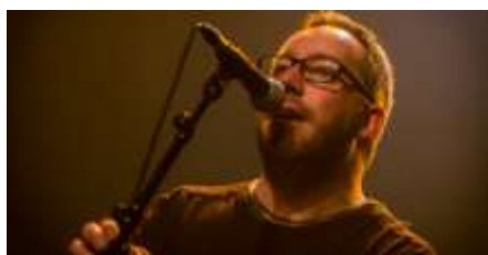
Christian Rivoalen © Droits réservés