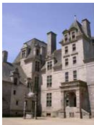
Château de Kerjean

Les visuels sont libres de droit uniquement dans le cadre de la promotion du « 400 ème anniversaire du marquisat de Kerjean ». Merci de mentionner le crédit photographique et de nous envoyer une copie de l'article : Chemins du patrimoine en Finistère, Service communication, 21 rue de l'église – BP34, 29460 Daoulas. Vous pouvez télécharger ces photos, ainsi qu'un plus large choix de visuels, depuis l'espace presse de notre site internet www.cdp29.fr (mot de passe sur demande).