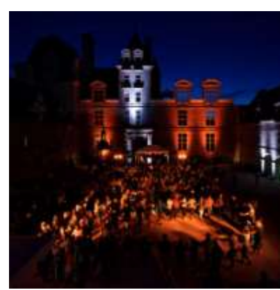
Grand Fest Noz de Kerjean