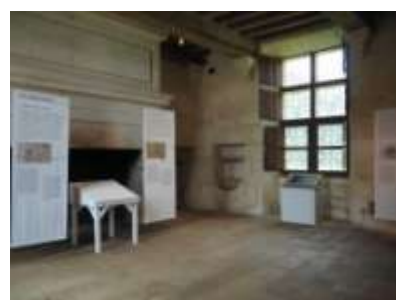
Exposition au Château de Kerjean