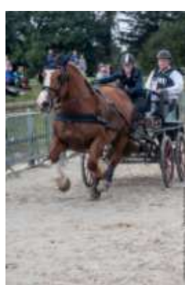
Concours d'attelage