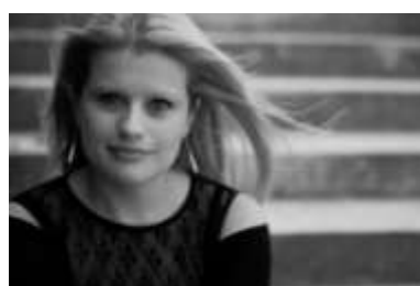
Aurore Keraudy © Droits réservés