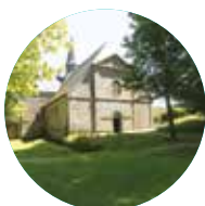
ABBAYE DU RELEC