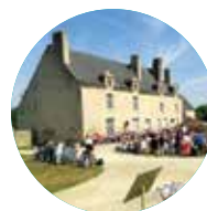
MANOIR DE KERNAULT