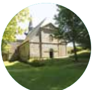
ABBAYE DU RELEC