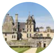
CHÂTEAU DE KERJEAN

Après l'Abbaye de Daoulas, poursuivez votre visite en découvrant les 4 autres sites de Chemins du patrimoine en Finistère