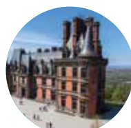
DOMAINE DE TRÉVAREZ

► 5 sites et autant de lieux où le plaisir de découvrir et de s'évader se nourrit de moments de partage, de savoirs et d'étonnements.