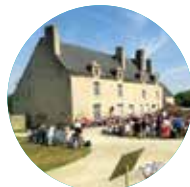
MANOIR DE KERNAULT