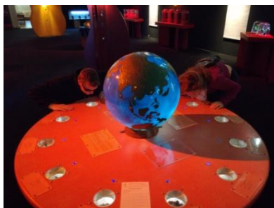
Né pour sentir

Les visuels sont libres de droit avant et jusqu'à la fin des expos-expériences « Né pour sentir » et « Les nouveaux nez », le 4 novembre 2018, uniquement dans le cadre de la promotion des expositions. Merci de mentionner le crédit photographique et de nous envoyer une copie de l'article : Chemins du patrimoine en Finistère, Service communication, 21 rue de l'église – BP34, 29460 Daoulas. Vous pouvez télécharger ces photos, ainsi qu'un plus large choix de visuels, depuis l'espace presse de notre site internet www.cdp29.fr (mot de passe sur demande).