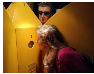
Né pour sentir