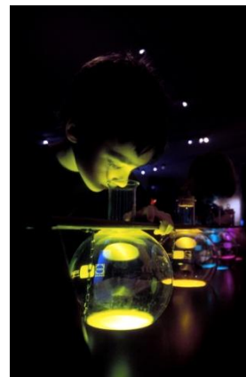
Né pour sentir