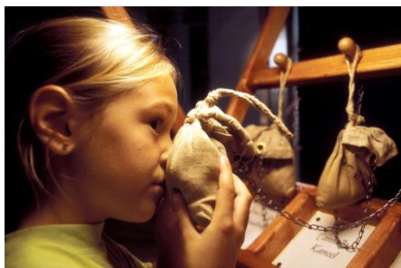
Les nouveaux nez