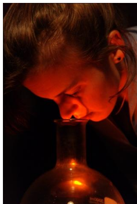
Né pour sentir