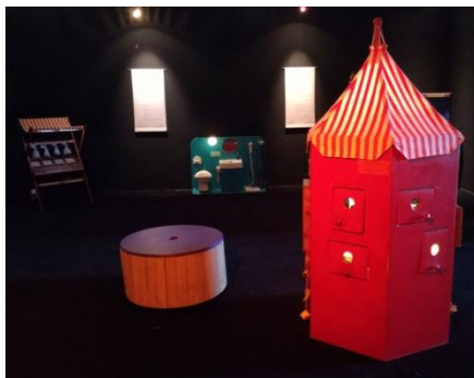
Les nouveaux nez © APEX