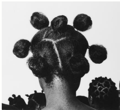
Mkpuk Eba, 1974 - J.D. Okhai Ojeikere - Courtesy Galerie MAGNIN-Paris