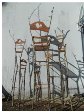
Chaises géantes d'Alice à Trévarez