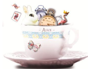
« Noël à Trévarez » 2017

Plus de photos sur simple demande au service presse : presse@cdp29.fr ou au 06 38 38 90 70 ou en téléchargement en HD et libres de droits sur notre site internet : www.cdp29.fr rubrique « Espace presse » (mot de passe : presse)