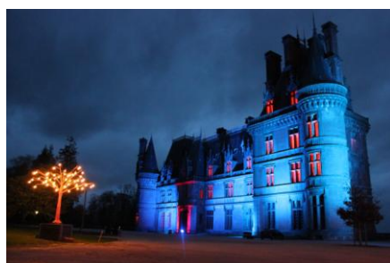
Les illuminations du château