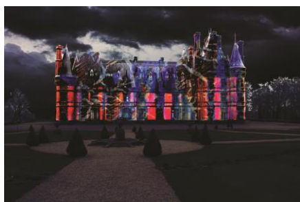
Les illuminations du château

Les visuels sont libres de droits avant et jusqu'à la fin de l'exposition, le 7 janvier 2017. Ils peuvent être utilisés uniquement dans le cadre de la promotion de l'exposition. Merci de mentionner le crédit photographique et de nous envoyer une copie de l'article : Chemins du patrimoine en Finistère , Service communication, 21 rue de l'église – BP34, 29460 Daoulas