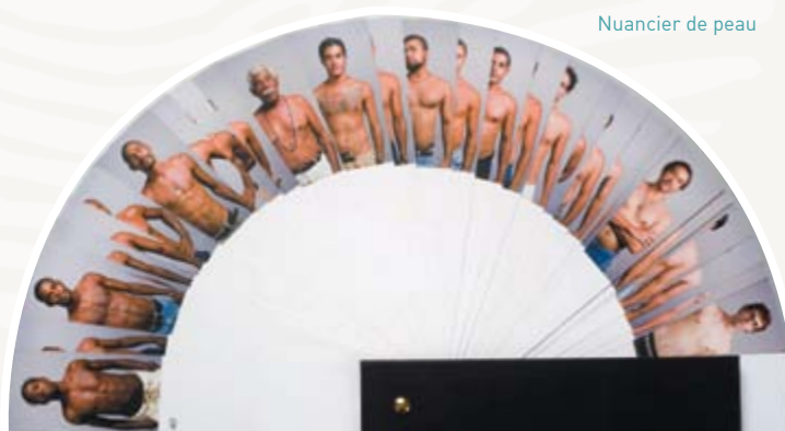
Nuancier de peau