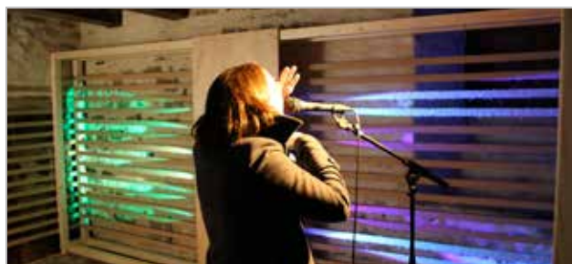
Les caves Ressentir la musique autrement Dispositif de transformation du son en vibrations colorées et de panneaux vibrants Scénographie : @ Guliver design Paris