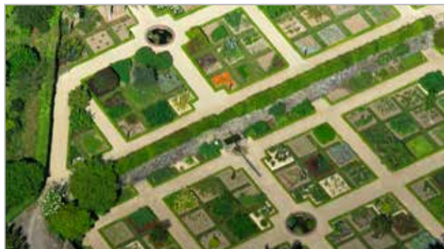
Vue aérienne du jardin médicinal, Abbaye de Daoulas

Les jardins de l'Abbaye, labellisés « jardin remarquable » en 2012, se découvrent à partir du mois d'avril. Une promenade en famille ou une visite accompagnée, des ateliers (sous réserve) d'initiation ou de perfectionnement permettent aux publics amateurs ou initiés de partager connaissances et plaisirs du jardin.