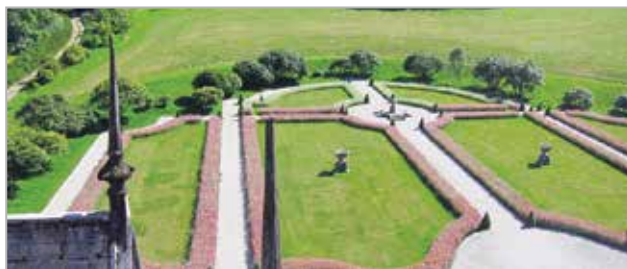
Le jardin régulier en fleur vue du château, Domaine de Trévarez

Création végétale - Printemps - Domaine de Trévarez