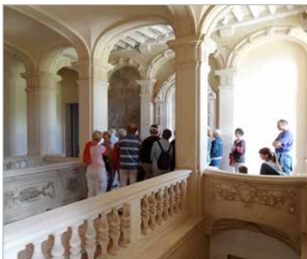
Visite de l'escalier d'honneur