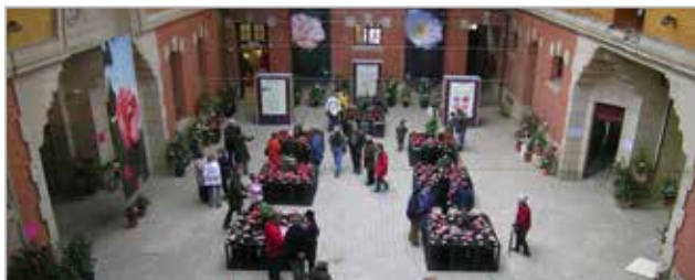
Festival du Camélia