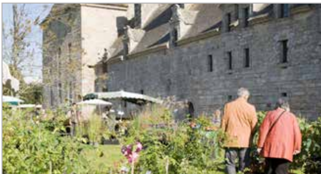
Journées des plantes de collection

Du vendredi 31 mai au dimanche 2 juin - Sur les 5 sites