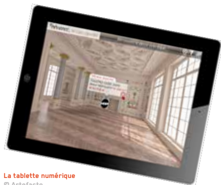
La tablette numérique

Les visiteurs peuvent désormais accéder au premier étage par le grand escalier et y jeter un coup d'œil. Une nouvelle étape dans la découverte du château !