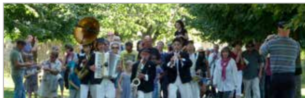
Échappée buissonnière, 2011

Échappée buissonnière, un rendez-vous réservé aux Mellacais et aux habitants de la Communauté de communes du pays de Quimperlé. Une soirée originale pour découvrir la programmation et se retrouver entre voisins pour un moment festif !