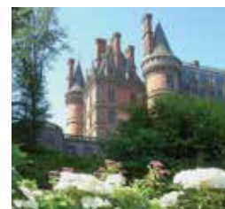
Domaine de Trévarez

L'Abbaye de Daoulas, le Manoir de Kernault, l'Abbaye du Relec et le Domaine de Trévarez sont des propriétés du département du Finistère