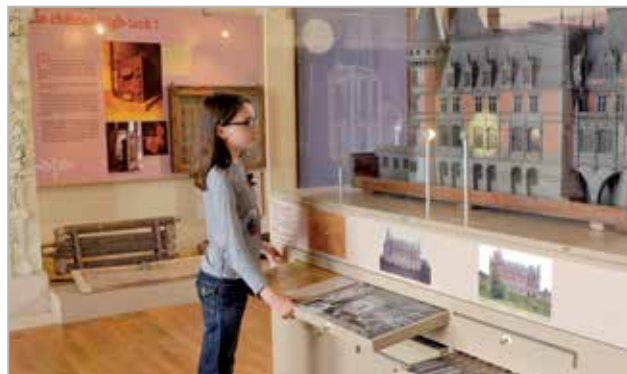
L'exposition Bâtir un rêve

Cette incursion dans l'histoire du domaine ne serait pas complète si l'on n'abordait le parc dont la composition fut pensée en fonction des points de vue depuis le château. Ainsi, de la salle à manger, le jardin régulier entouré d'un théâtre de verdure et de camélias centenaires s'offre à la vue. Une promenade dans le parc permet de découvrir d'autres ambiances bien différentes, comme le jardin de style italien et sa fontaine au sanglier, le jardin romantique et sa cascade, etc., sans oublier les rhododendrons et les azalées, collections nationales, qui font la renommée du domaine depuis de nombreuses années.