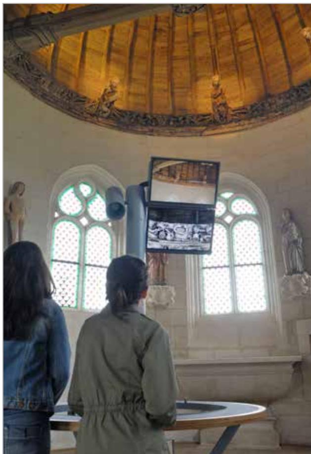
Les yeux vers le ciel Lunette d'observation de la sablière sculptée de la chapelle

Le Château de Kerjean propose à ses visiteurs de découvrir son histoire longue de cinq siècles à travers l'exposition permanente « Les Riches Heures de Kerjean » mettant en valeur la richesse et la spécificité de ce patrimoine.