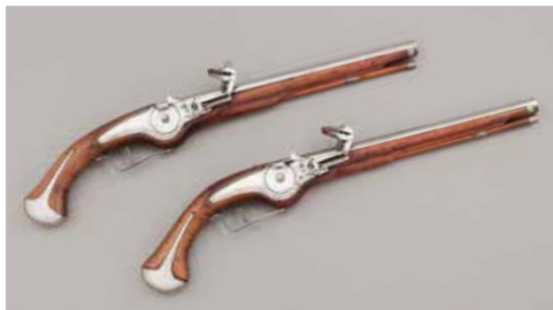
Paire de pistolets à rouet, vers 1660

Pontcallec ouvrent les portes de leurs repaires et plongent le visiteur dans leur univers. Il reste encore à faire face aux armes du crime : de nombreux pistolets, épées et arbalètes des 16 e -18 e siècles montrent les évolutions techniques de l'armement au cours de cette période. La justice heureusement veille, une justice certes brutale mais soucieuse du droit et qui ne condamne pas sans preuve. Un riche parcours émaillé d'objets et de documents, de bornes d'écoute, d'animations multimédias.