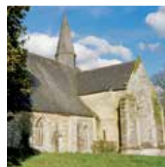
Abbaye du Relec