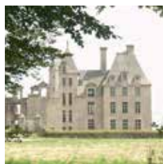
Château de Kerjean