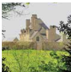
Manoir de Kernault