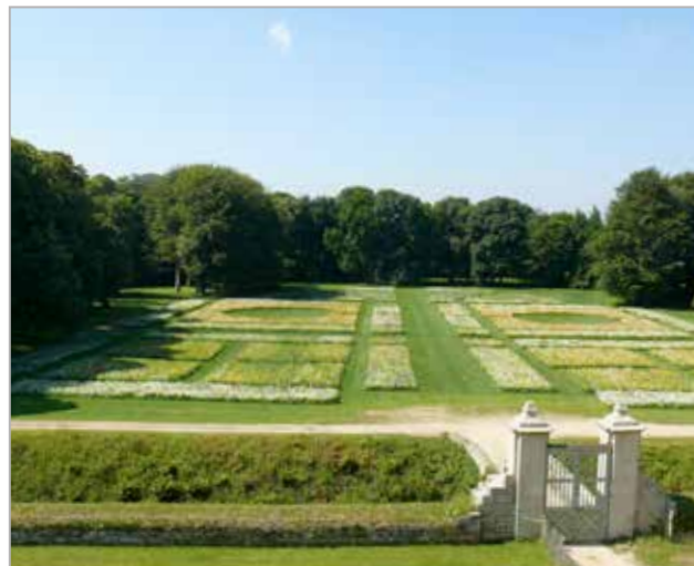
Le jardin de propreté, Château de Kerjean

Le jardin de fleurs est l'évocation historique du jardin de propreté de Kerjean aujourd'hui disparu. La reprise des tracés géométriques en vogue à la Renaissance mais aussi au 18 e , période choisie pour la restauration des alignements du château, et la plantation de différents mélanges de fleurs annuelles en font un jardin régulier du 21 e siècle. Le promeneur pourra déambuler sur des allées strictement tondues, au milieu de floraisons exubérantes.