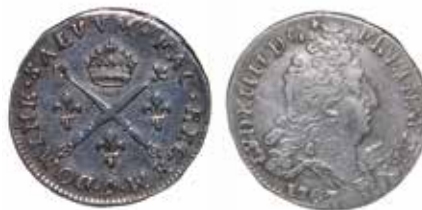
Écu de Louis XVI