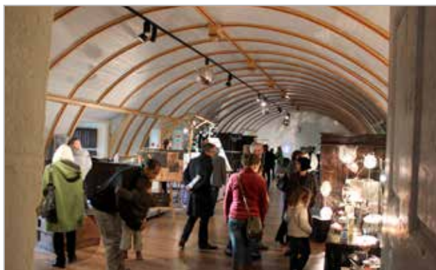
Noël des créateurs, 2011