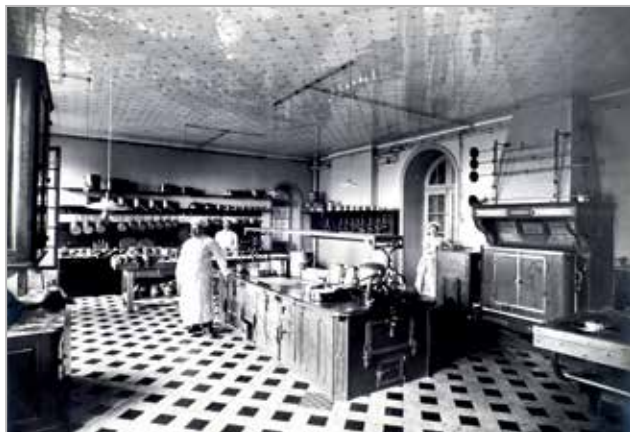
La cuisine du château de Trévarez en 1910

Exposition permanente à partir du 16 mars - Domaine de Trévarez