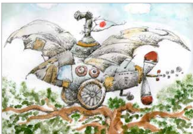
Noël à Trévarez, 2012