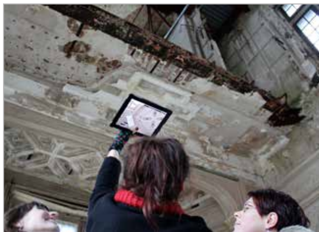
Visite de l'aile ouest