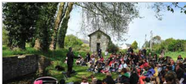
Des mots des mômes, 2012 © Dominique Vérité

Jeudi de l'Ascension 9 mai - Contes - Manoir de Kernault