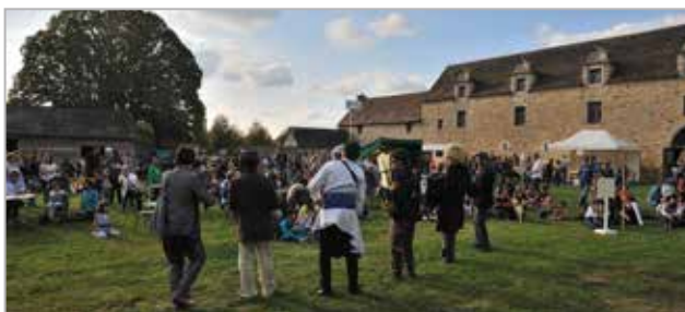
Fête d'automne, 2011

Cette journée autour de la protection et la valorisation de la nature met l'accent sur le travail mené tout au long de l'année dans le parc. « Faune, flore et gestion des espaces », « Pomme et verger de A à Z », « Jardiner au naturel », « Saveurs d'automne » sont autant de thématiques à découvrir dans une ambiance festive et conviviale.