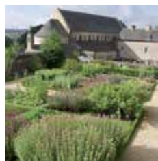
Abbaye de Daoulas

Abbaye de Daoulas Château de Kerjean Manoir de Kernault Abbaye du Relec Domaine de Trévarez