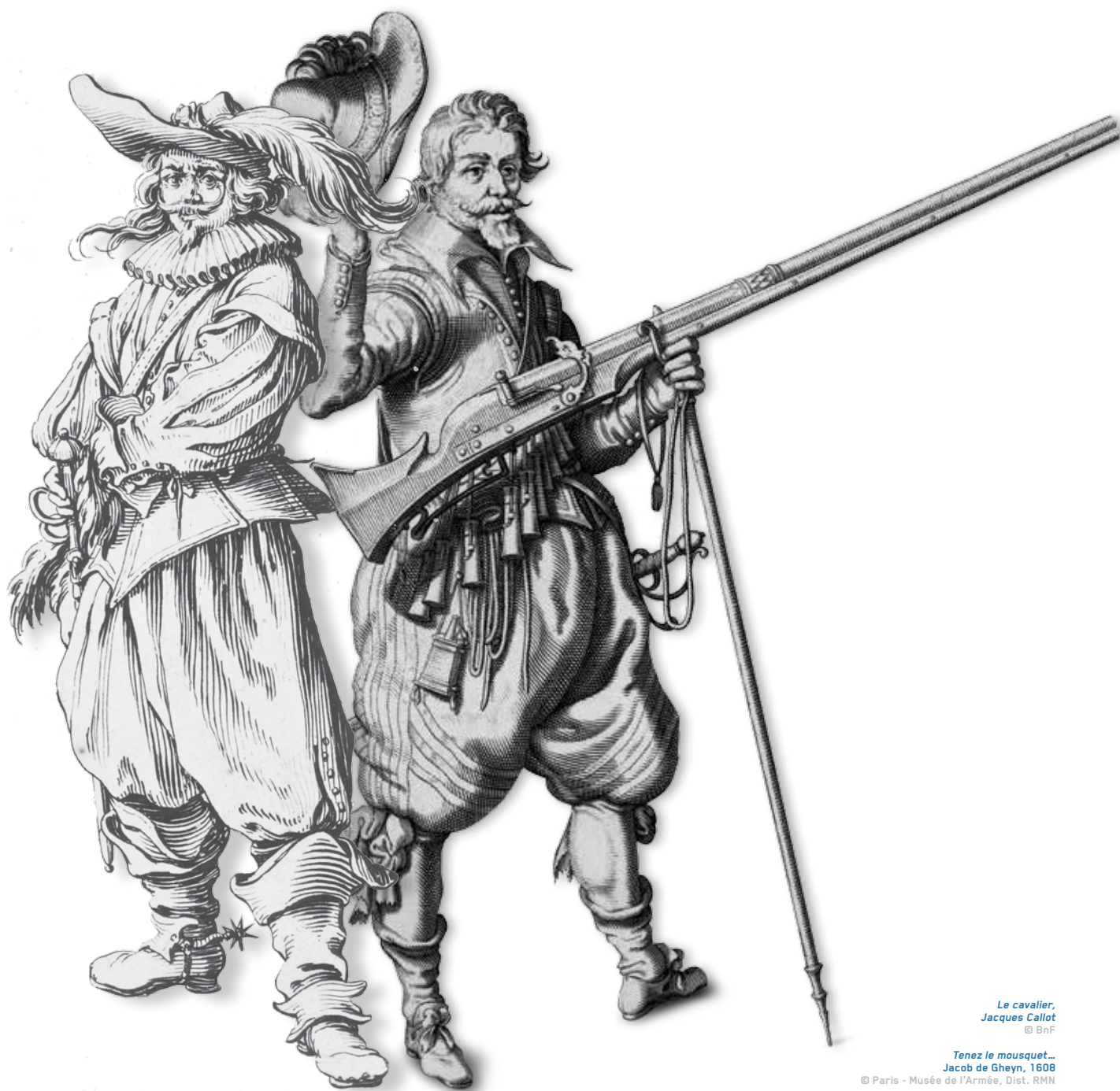
Le cavalier, Jacques Callot