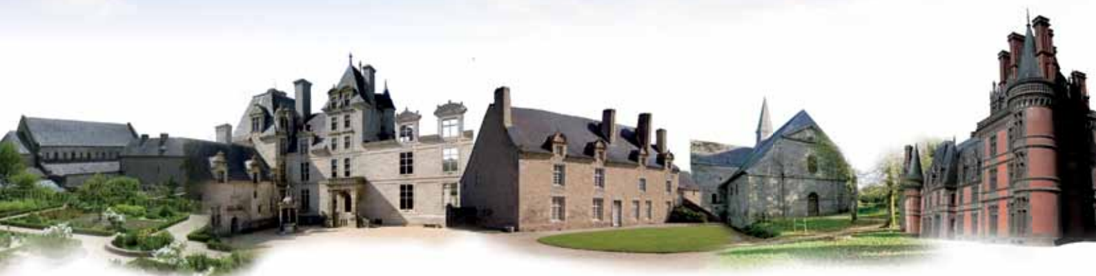
Abbaye de Daoulas : Château de Kerjean : Manoir de Kernault : Abbaye du Relec : Domaine de Trévarez

À l'extrême pointe de l'Europe et d'une péninsule étirée entre mer et océan, Chemins du patrimoine en Finistère réunit 5 sites patrimoniaux majeurs et tisse entre eux les liens d'une nouvelle politique culturelle. Chaque année, l'Abbaye de Daoulas, le Château de Kerjean, le Manoir de Kernault, l'Abbaye du Relec et le Domaine de Trévarez vous invitent à explorer la diversité culturelle au travers d'une programmation riche et variée.