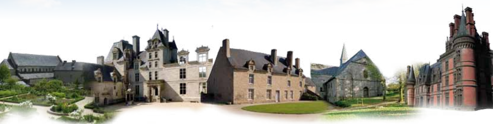
Abbaye de Daoulas : Château de Kerjean : Manoir de Kernault : Abbaye du Relec : Domaine de Trévarez

À l'extrême pointe de l'Europe et d'une péninsule étirée entre mer et océan, Chemins du patrimoine en Finistère réunit 5 sites patrimoniaux majeurs et tisse entre eux les liens d'une nouvelle politique culturelle. Chaque année, l'Abbaye de Daoulas, le Château de Kerjean, le Manoir de Kernault, l'Abbaye du Relec et le Domaine de Trévarez vous invitent à explorer la diversité culturelle au travers d'une programmation riche et variée.