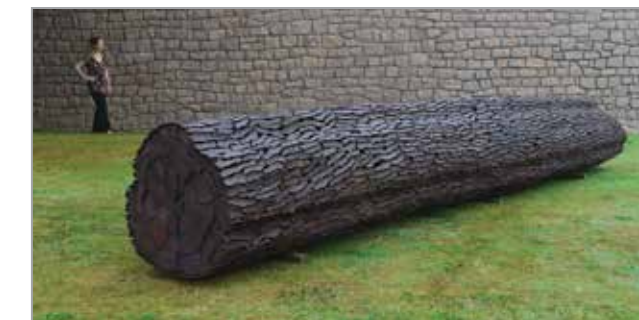
Pipeline fossile 2013 © Marc Didou

Le parc de l'Abbaye fait peau neuve ! La création d'un jardin des arbres et arbustes médicinaux est l'opportunité de rétablir l'équilibre entre le jardin des simples, le parc et les bâtiments. Le projet, mis en œuvre à partir de l'automne 2015, doit installer au sein d'un parcours paysager une sélection d'essences venues de toute la planète : la diversité des espèces illustre celle des pharmacopées constituées par les sociétés humaines dans leur rapport au corps, à la maladie, en fonction de leurs croyances ou connaissances scientifiques, et selon les ressources offertes par leur environnement.