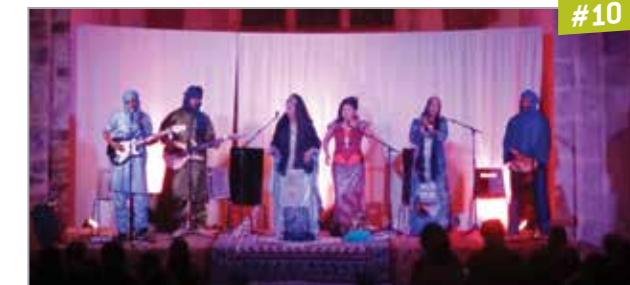
Arrée Voce, 2014

Le Festival Arrée Voce met en regard différentes esthétiques de chants de tradition orale de Bretagne et d'ailleurs, mettant en évidence leur richesse et leur diversité, qu'ils soient monodiques ou polyphoniques, dansants ou mélancoliques : Gwerzioù , chants polyphoniques, chants de femmes. Tous expriment au travers de leurs différences les grands thèmes de la vie avec des techniques de chant également différentes selon les régions concernées.