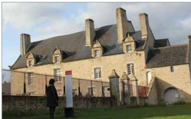
Parcours d'interprétation

Parcours d'interprétation dans l'enceinte du manoir et le parc Manoir de Kernault