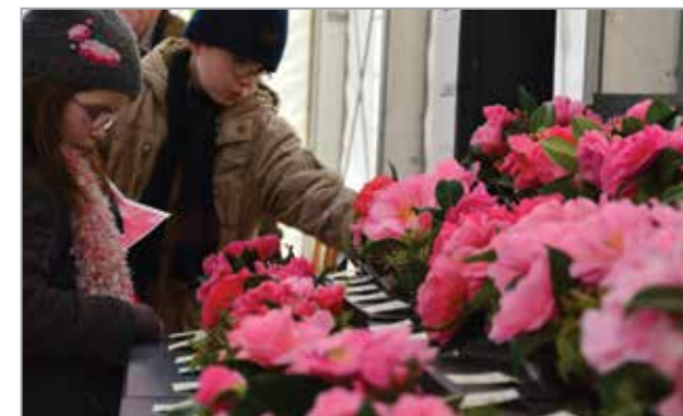
Trévarez en camélia, 2013

En partenariat avec la Société bretonne du camélia