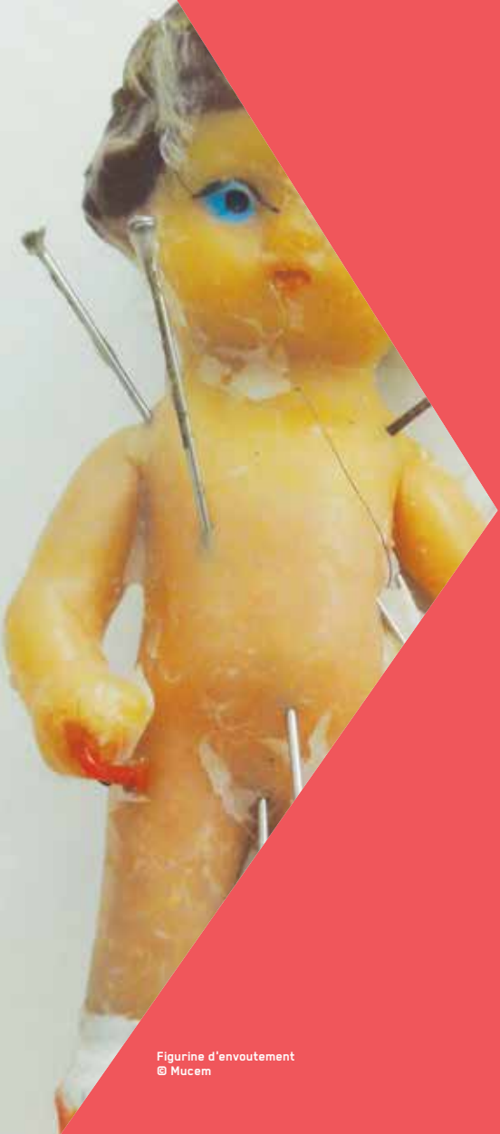
Figurine d'envoutement