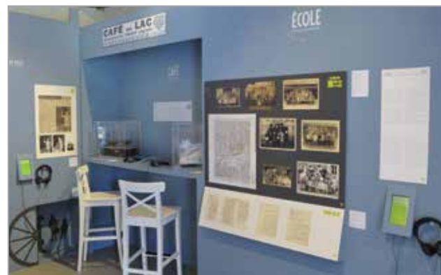
Exposition permanente Ma parole ! L'Abbaye du Relec au XX e siècle

Jusqu'au 18 e siècle, les moines cisterciens, installés au Relec depuis le 12 e siècle, ont contribué à façonner le paysage de la vallée du Queffleuth, au bas des Monts d'Arrée. Après la Révolution, les religieux quittent les lieux et les premiers laïcs s'y installent. Hésitante tout d'abord, cette appropriation s'affirme au 20 e siècle.