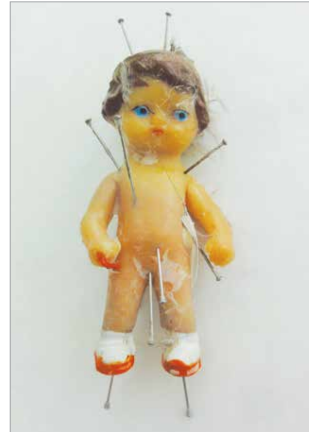
Figurine d'envoutement

Exposition du 16 juin 2016 au 2 janvier 2017 - Abbaye de Daoulas