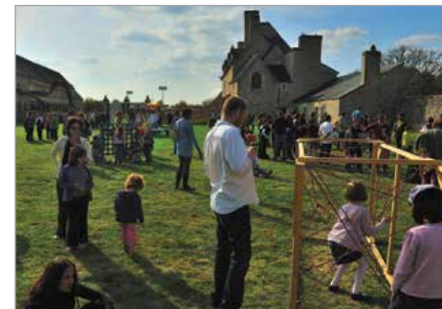
Fête d'automne, Manoir de Kernault, 2013

Dimanche 16 octobre - Manoir de Kernault