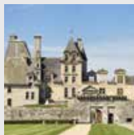
Château de Kerjean