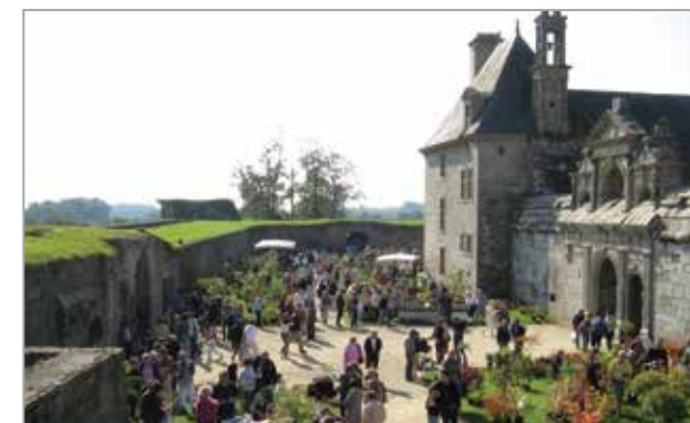
Journées des plantes de collection, 2013

Samedi 24 et dimanche 25 septembre - Château de Kerjean