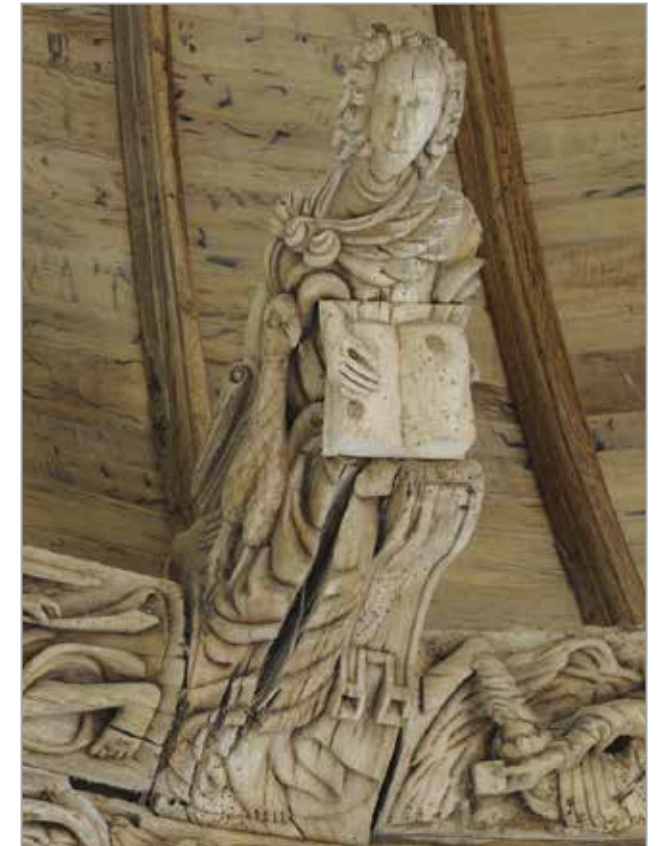
Saint-Jean Chapelle du Château de Kerjean © Dorian Rollin

Le parcours de l'exposition se construit autour de deux fils conducteurs : un parcours historique, analytique sur un point charnière de l'histoire bretonne - la question de la place du catholicisme dans la Bretagne du 16 e siècle - et un regard contemporain sur la place du sacré dans nos sociétés. Des œuvres d'art contemporain dialoguent avec les œuvres anciennes, tissant des passerelles entre la vie religieuse des Bretons au 16 e siècle et nos questionnements actuels.