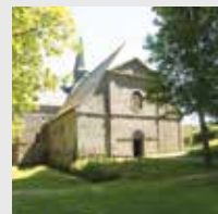
Abbaye du Relec