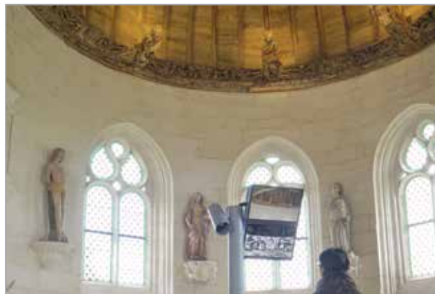
Exposition permanente Les Riches heures

Exposition permanente - Château de Kerjean Toute l'année