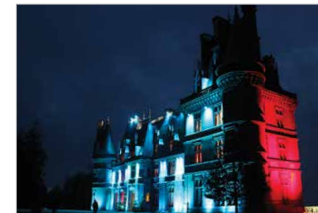
Noël à Trévarez - Illuminations du château et des allées par le Collectif Zarmine, 2015