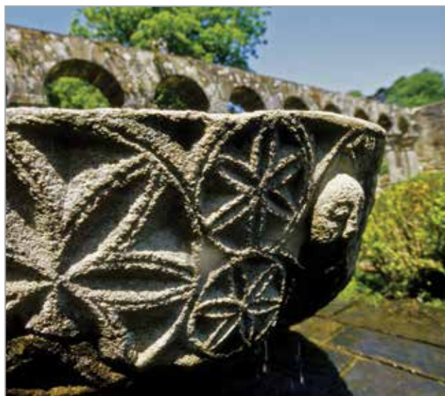
Vasque, Cloître, Abbaye de Daoulas

Chaque année, les journées du patrimoine mettent à l'honneur un aspect de la grande richesse de notre patrimoine. Chemins du patrimoine en Finistère s'inscrit dans cette manifestation en proposant des éclairages inédits du patrimoine bâti et naturel qui compose les sites au travers de visites flash.