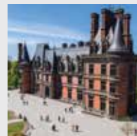
Domaine de Trévarez

L'Abbaye de Daoulas, le Manoir de Kernault, l'Abbaye du Relec et le Domaine de Trévarez sont des propriétés du département du Finistère. Le Château de Kerjean est une propriété de l'État.