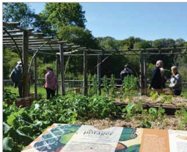
Le potager du Moyen Âge à nos jours, 2014

Depuis 2014, un nouvel espace est ouvert pour accueillir un jardin potager. On y découvre, au fil des carrés qui le composent, l'évolution des jardins du Moyen Âge à nos jours, en même temps que l'on apprend tout sur la cinquantaine d'espèces parfois étranges qui occupent le potager, de la mongette à la ficoïde glaciale. C'est également un lieu de promenade agréable, en bordure d'étang, avec des espaces naturels clos, lieux de pause et de contemplation. C'est aussi un jardin de senteurs et de saveurs, avec des plantes odorantes et d'autres que l'on peut goûter au moment des récoltes. Après l'ouverture d'une autre parcelle sur le compagnonnage des légumes en 2015, l'espace s'enrichit cette année d'un nouveau parcours sur le thème des céréales.