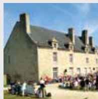
Manoir de Kernault