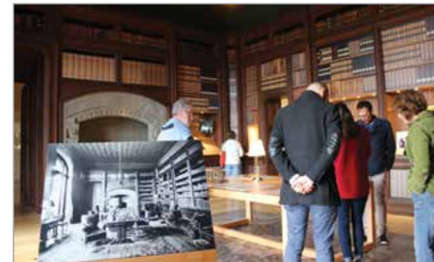
Bibliothèque, château de Trévarez