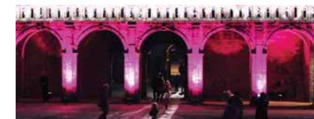
Noël des Créateurs - Illumination du château, 2015