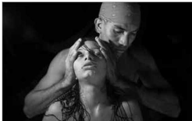
Maria Lionza rituals

Cristina Garcia Rodero Exposition photographique dans les jardins À partir de mai - Abbaye de Daoulas