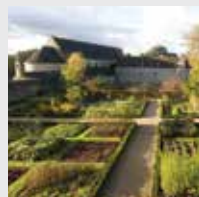
Abbaye de Daoulas