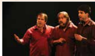
Brou-Hamon- Quimbert Haute-Bretagne