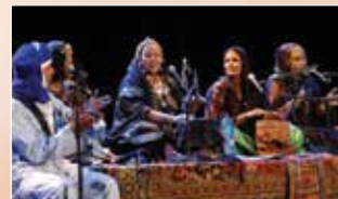
Tende Disswat Algérie