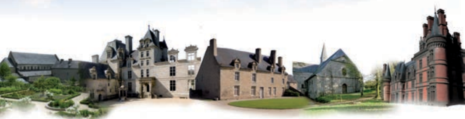
Abbaye de Daoulas : Château de Kerjean : Manoir de Kernault : Abbaye du Relec : Domaine de Trévarez

À l'extrême pointe de l'Europe et d'une péninsule étirée entre mer et océan, Chemins du patrimoine en Finistère réunit 5 sites patrimoniaux majeurs et tisse entre eux les liens d'une nouvelle politique culturelle. Chaque année, l'Abbaye de Daoulas, le Château de Kerjean, le Manoir de Kernault, l'Abbaye du Relec et le Domaine de Trévarez vous invitent à explorer la diversité culturelle au travers d'une programmation riche et variée.