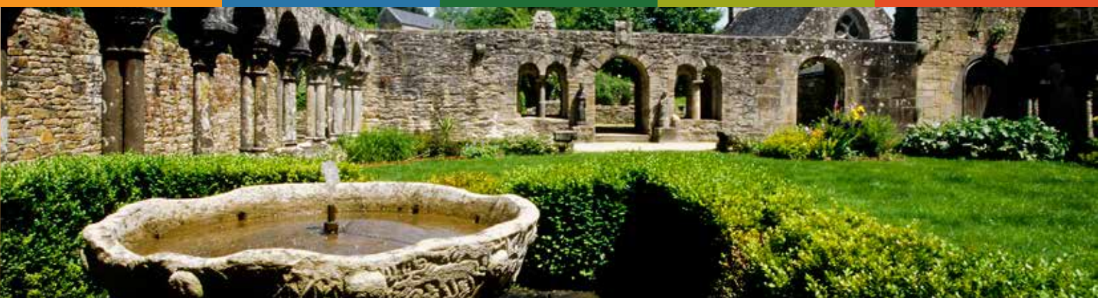
Abbaye de Daoulas - Château de Kerjean - Manoir de Kernault - Domaine de Trévarez