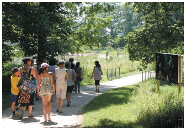
« Chasseurs de miel » Exposition photographique d'Éric Valli Abbaye de Daoulas, Daoulas, 2017

Les Balades photographiques de Daoulas sont nées en 2014 d'une coopération entre la commune et l'Abbaye de Daoulas avec la volonté de favoriser l'accès à la culture pour le plus grand nombre. En 2018, en lien avec l'exposition annuelle de l'Abbaye « Cheveux chéris, frivolités et trophées », J.D. Okhai OJEIKERE et Medina DUGGER rendent un hommage à la beauté des coiffures nigérianes.