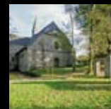
Abbaye du Relec Plounéour-Ménez