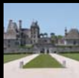
Château de Kerjean Saint-Vougay