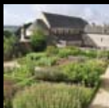
Abbaye de Daoulas Daoulas

Le Domaine de Trévarez fait partie de l'EPCC Chemins du patrimoine en Finistère. Visitez également