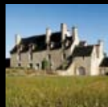
Manoir de Kernault Mellac