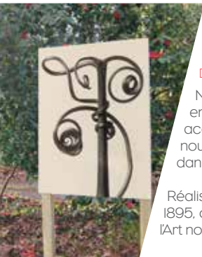
Montage ©CDP29 Photo : Karl Blossfeldt