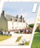
MANOIR DE KERNAULT