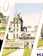
CHÂTEAU DE KERJEAN