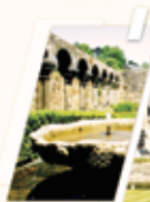
ABBAYE DE DAOULAS