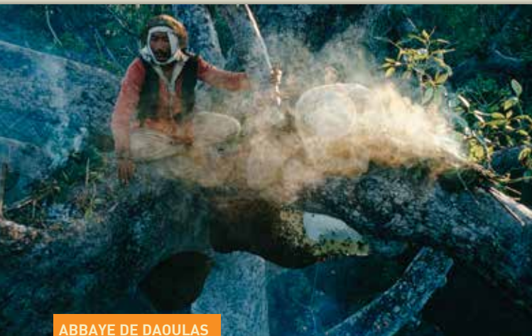
ABBAYE DE DAOULAS

Éric Valli est un « chasseur d'images » mais également un écrivain et un réalisateur. Depuis 1981, il photographie des endroits inaccessibles du monde, travaillant pour des titres tels que National Geographic, GEO, etc. En 1987, ses photos des chasseurs de miel du centre-ouest du Népal remportent le World Press Award . En 1990, il photographie les chasseurs des Ténèbres dans l'ouest de la Thaïlande et reçoit une nomination aux Oscars du meilleur documentaire pour " Himalaya, l'enfance d'un chef ".