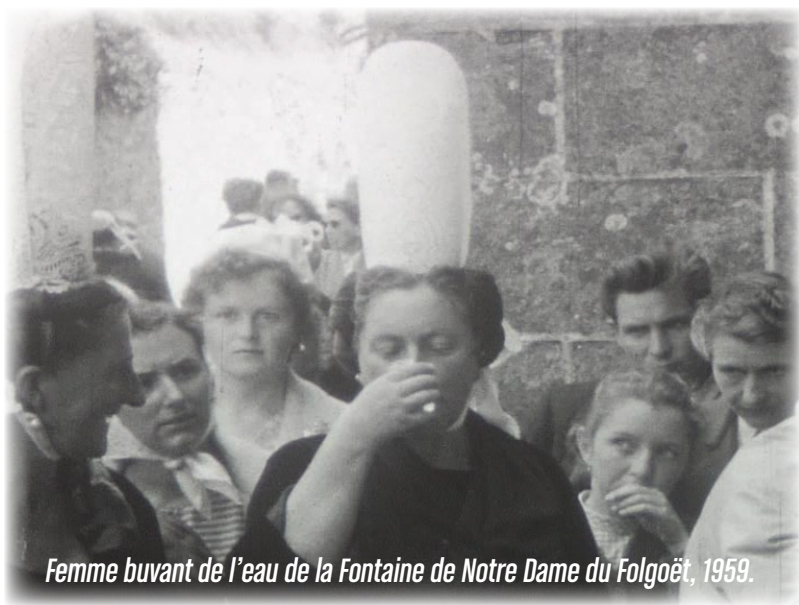
Femme buvant de l'eau de la Fontaine de Notre Dame du Folgoët, 1959.